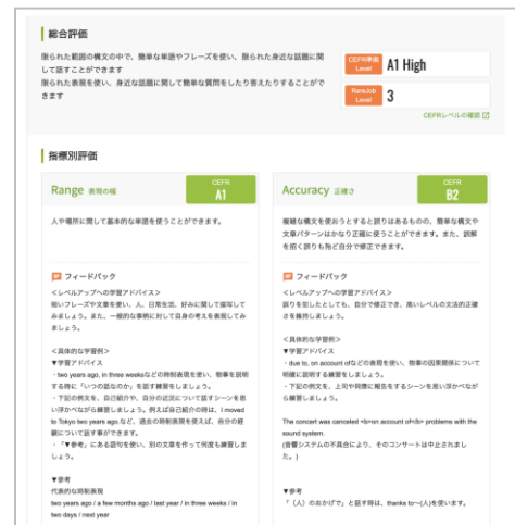
（右）「レアジョブ・スピーキングテスト powered by PROGOS」テスト結果シートイメージ